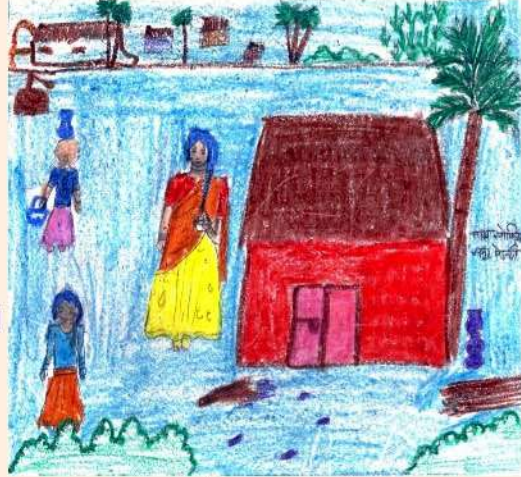
चित्र : सोफिया, समूह—मेहन्दी