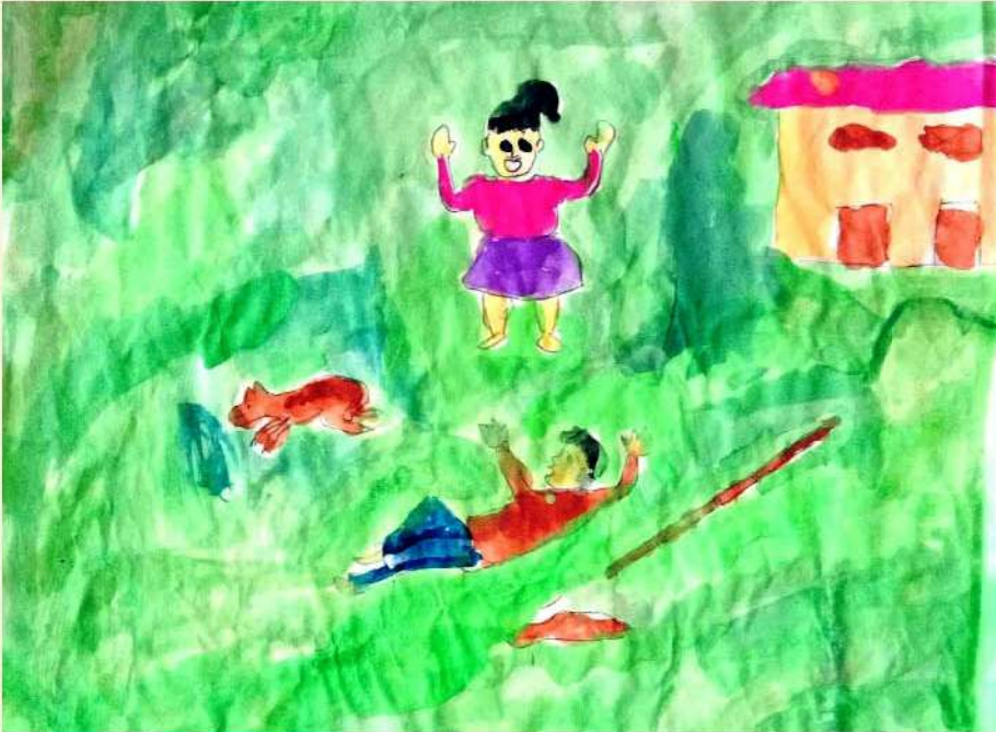
चित्र : कौशल्या और सादिया; समूह—महल