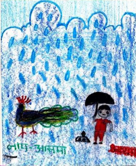
चित्र : आसमा, समूह-मेहन्दी

जब काले-काले बादल आते हैं, खूब पानी बरसाते हैं, मोर नाच दिखाते हैं, मेंढक खूब फूदकते हैं, छाते सब के खुल जाते हैं, बच्चे खूब नाव तैराते हैं, सर्दी, गर्मी या बरसात, हमें सारे मौसम भाते हैं।