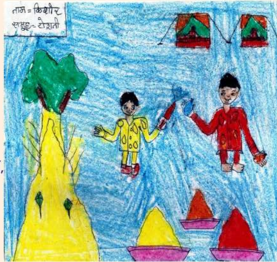
चित्र : किशोर, समूह-रोशनी

अपने संग रंगों को लाई, बच्चे धूम मचाते आए, रंग-गुलाल उड़ाते आए, होली आई, होली आई, अपने संग है मस्ती लाई, रंग-बिरंगी होली आई, अच्छा-अच्छा खाना बनाया, सबने सबको रंग लगाया, होली आई, होली आई, अपने संग है मस्ती लाई,