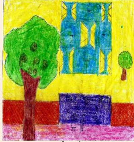
चित्र : रेहनुमा, समूह-अमन